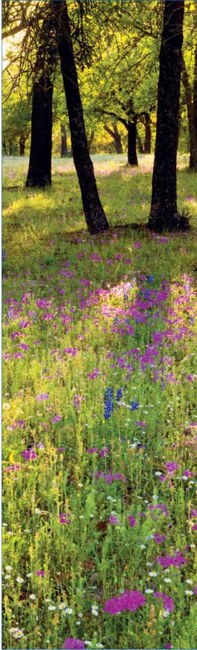
Zum Auftanken mit der vbi.