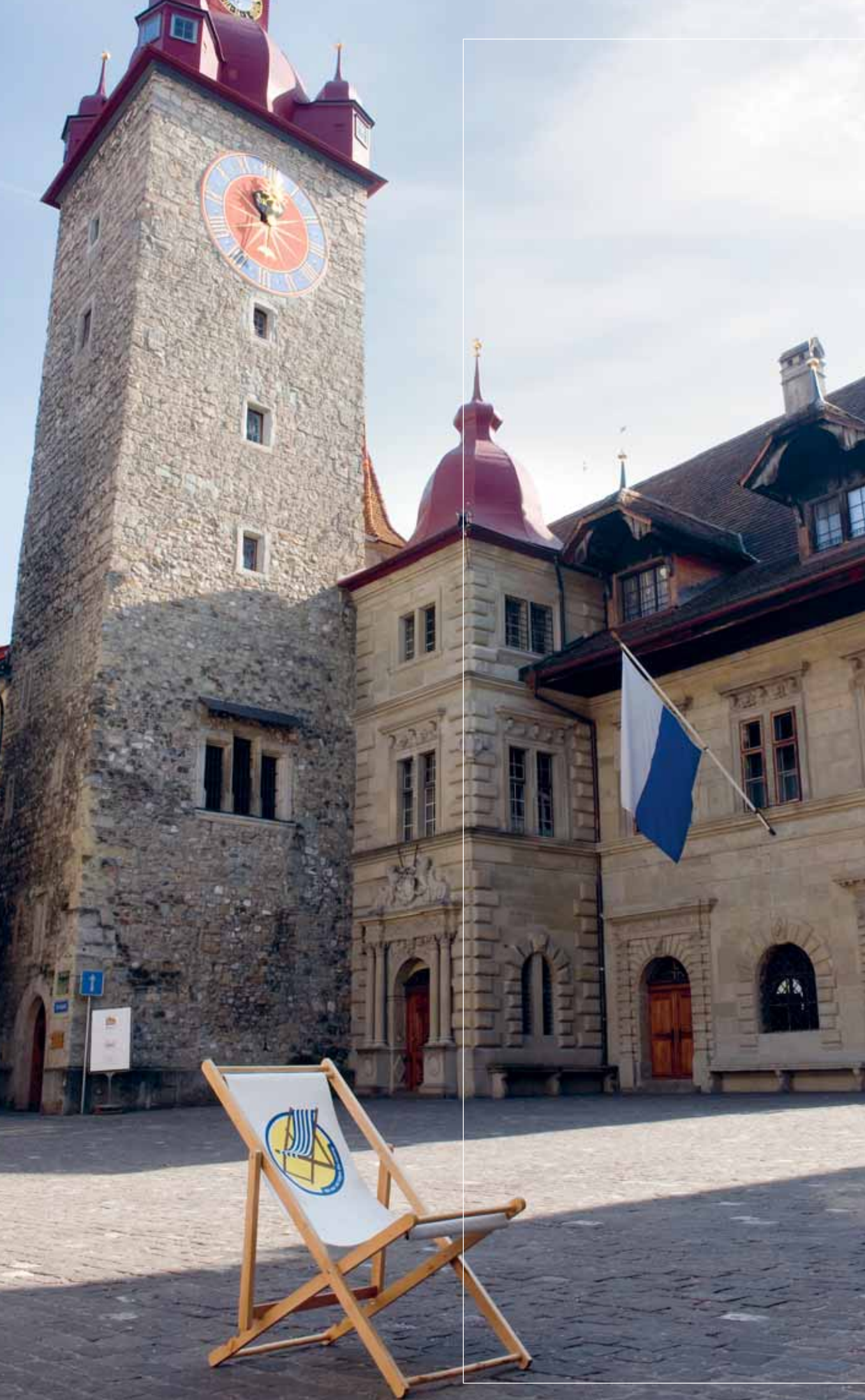
Zum Heiraten mit der vbl.