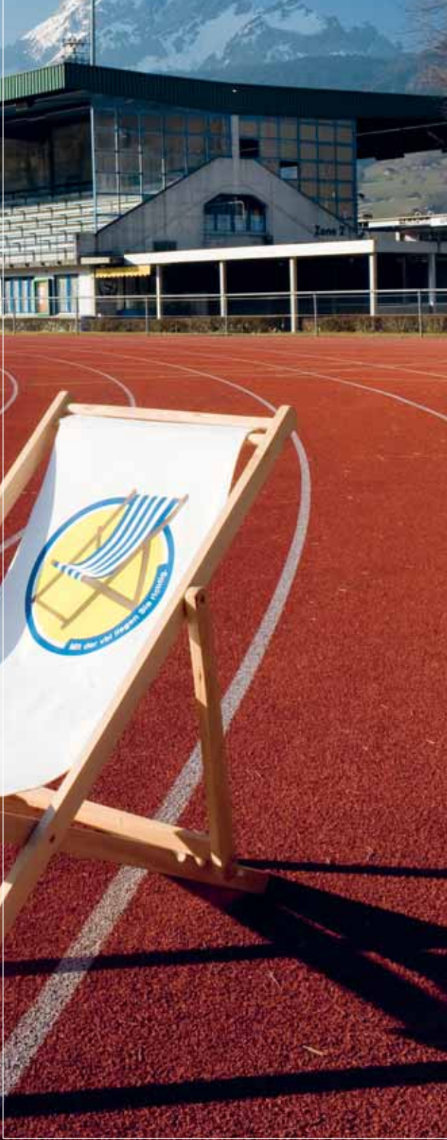
Zum Weltrekord mit der vbl.