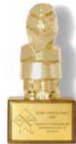
Oskar des Golden Creativity Award

Wochentagen am Morgen und am Abend und erfreut sich zunehmender Beliebtheit. Gefahren wird mit Reisebussen. Ein Teil der Fahrleistung übernimmt die Auto AG Uri. Das gemeinsam mit der SBB realisierte Projekt wurde von Idée Suisse mit dem «Golden Creativity Award» ausgezeichnet.