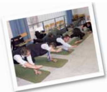
Weiterbildung - zum Thema Gesundheit